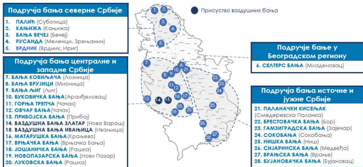
Слика бр. 1: Преглед бањских и климатских места у Републици Србији са статусом подручја бање