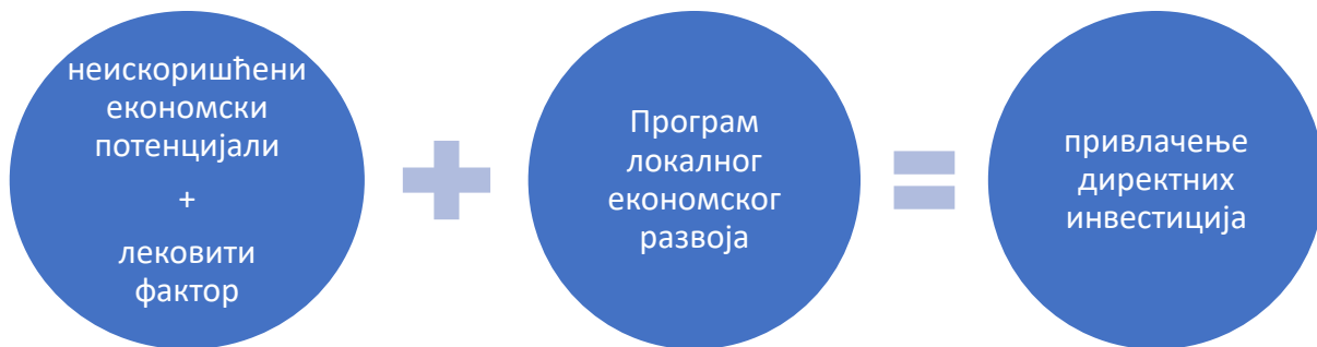
Слика бр. 4: Утицај неискоришћених потенцијала и Програма локалног економског развоја на привлачење директних инвестиција